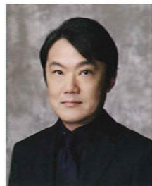
千住 明 作曲家/ナビゲーター

1960年東京生まれ。東京藝術大学作曲科卒業。同大学院首席修了。代表作にピアノ協奏曲「宿命」(ドラマ「砂の器」劇中テーマ曲)オペラ「万葉集」等。ドラマ「家なき子」「ほんまもん」「砂の器」「風林火山」映画「愛を乞うひと」「黄泉がえり」「涙そうそう」アニメ「機動戦士Vガンダム」「鋼の錬金術師FA」「革命機ヴァルヴレイヴ」NHKスペシャル「至高のバイオリン ストラディヴァリウスの謎」NHK「日本 映像の20世紀」TV「アイアンシェパ」テレビ未来遺産「CM「アサヒ スーパードライ」等音楽担当作品は数多い。受賞歴多数。作曲家・編曲家・音楽プロデューサーとして幅広く活躍。NHK「日曜美術館」のキャスターもつとめた。