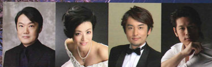
カメラ館企画展 展示作品より